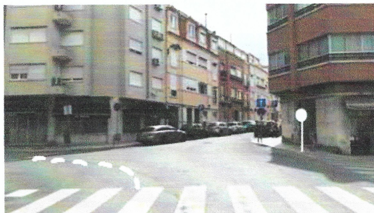
Fig. 1 - Vista a partir da Rua Actriz Virgínia. Os automóveis apresentam-se pela esquerda. Proposta de espelho oposto orientado para a Rua abade Faria à esquerda e linha a tracejado.

A solução que preconizamos passa por um lado pela melhoria da visibilidade do cruzamento – através da colocação de um espelho em local adequado (Fig.1); pelo reforço da indicação de perda de prioridade de quem vem da Abade Faria – pintando no chão o sinal de perda de prioridade (Fig.2); e pela marcação a tracejado do limite interior da curva a efectuar por quem quer virar à esquerda, vindo da actriz Virgínia, de forma a aumentar o ângulo de visibilidade.