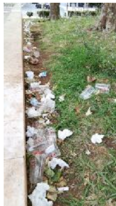
Copos descartáveis no Jardim dos Cavaleiros antes da implementação dos copos retornáveis.

Ora, a Junta de Freguesia e a Câmara Municipal concessionam alguns quiosques na freguesia onde é comercializada cerveja e outras bebidas, como os quiosques recentemente instalados no Parque Urbano da Quinta do Vale da Montanha e na Avenida Rovisco Pais, e outros em diversos pontos da freguesia como o da Alameda Dom Afonso Henriques e o do jardim em frente ao Ministério da Segurança Social, entre outros pequenos quiosques.